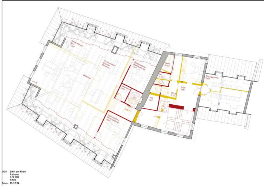
Abbildung 3 - Neue vertikale Erschiessung und Nutzbarmachung des Dachgeschosses