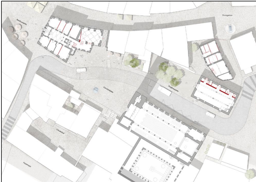
Abbildung 1 - Situationsplan mit der städtebaulichen Einbindung der Gebäude Rathaus, Haus Steinbock, Zeughaus und Gnehmgaragen